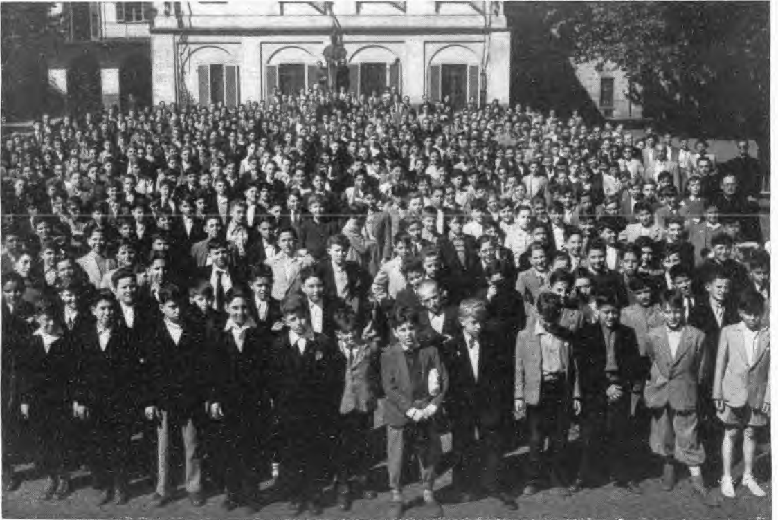
Torino - Giovani del nostro Istituto di Genova-Sampierdarena in pellegrinaggio a Maria Ausiliatrice.

il seguente telegramma firmato dallo stesso On.mo Superiore Generale: « Roma 23. - Tuttora sotto influenza suggestiva benedizione statua glorioso Giovanni Bosco presso insigni Reliquie Giovanni Lassalle, vigilia solennità Giovanni Precursore, impartita degno rappresentante venerando successore grande Apostolo italiano gioventù, ringraziamo partecipazione, ossequiamo, rinsaldiamo preziosi spirituali vincoli Congregazioni sorelle, auspi-