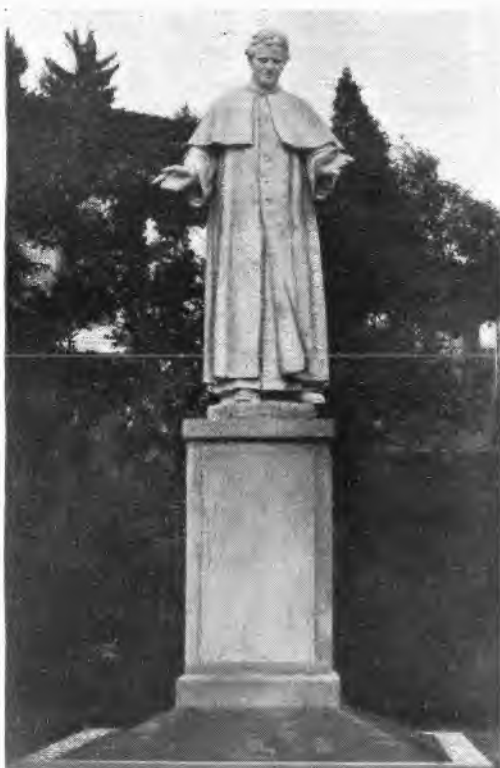
Luino - Monumentino di D. Bosco nell'Oratorio delle Figlie di Maria Ausiliatrice.