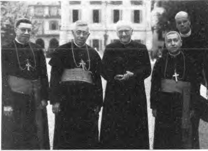
Torino - L'Arcivescovo di Messico, coi Vescovi di Vera Cruz e di Tacámbaro insieme al Rettor Maggiore.